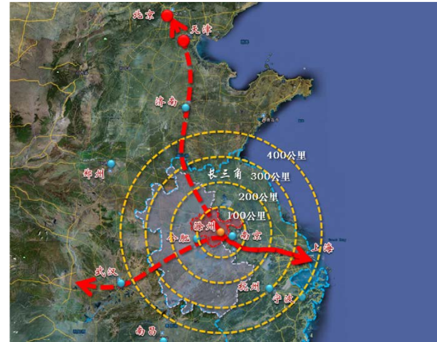
图 2-2 滁州市交通区位图