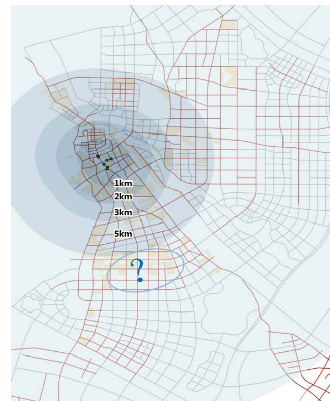
图 9-2 现状大型百货店服务范围示意图

按一般经验，规模以上百货的有效辐射范围为 3-5 公里，由图 9-2 可知现状大型百货辐射范围未能覆盖南部居住片区，存在南北分布不均象限。